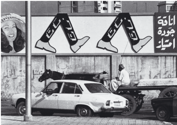
► Une rue d'Alexandrie, en Égypte.

Examinons ces critères. Vous commencez par saisir systématiquement le pays. Comme vous le verrez par la suite, il est possible de sélectionner de nombreuses photos à la fois et de leur attribuer simultanément le mot-clé "Égypte". Vous indiquez ensuite le lieu. Comme vous l'avez fait pour le pays, vous sélectionnez toutes les photos prises à Alexandrie afin de n'avoir pas à saisir ce mot des dizaines ou des centaines de fois.