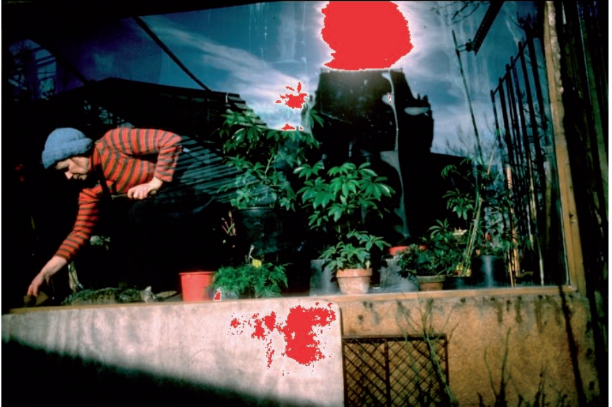
► Les aplats rouges révèlent les hautes lumières écrêtées.

Comme le montre la photo d'une fleuriste, les pixels écrêtés apparaissent en rouge sur l'écran ACL et clignotent. Ils peuvent être affichés lors de la visée, ou en visionnant l'image.