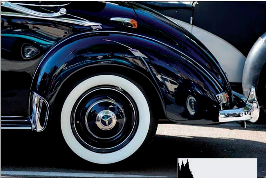
► Histogramme d'une photo aux tons sombres, mais pourtant correctement exposée.

Un histogramme déséquilibré ne signifie pas forcément que la photo est mal exposée. Par exemple, dans la photo d'une roue d'une ancienne Mercedes 220, l'histogramme laisserait à penser que la photo est sous-exposée alors qu'il n'en est rien : elle est seulement riche en tons foncés tout simplement parce que le sujet est lui-même foncé. Les luminosités sombres agglutinées à gauche sont celles de la carrosserie de la voiture. Les deux petits renflements à droite sont formés par des tons gris clair du sol et d'une autre voiture au second plan, et par le flanc blanc du pneu.